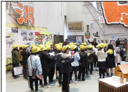
南笠東小学校3年生

1月と2月は凧作りのシーズンです。2月1日には草津市の南笠東小学校3年生が見学と凧作りで来館していただきました。2月17日(土)には、長浜市のびわまちづくりセンターでの凧作りでした。その日東近江市は晴れたり曇ったりの空模様でしたが、やはり長浜市、1日中雪が降っており、凧作りだけで凧揚げは出来ませんでした。2月18日(日)には、守山市の中洲公民館で凧作りがありました。冬晴れのちょうどよい風が吹く中、すぐ近くに野洲川の広い河川敷があり、雪化粧した綺麗な比良山系を見ながら凧揚げを行いました。