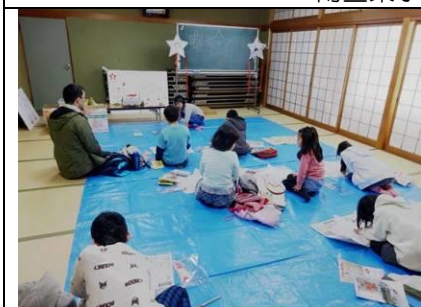
びわまちづくりセンター