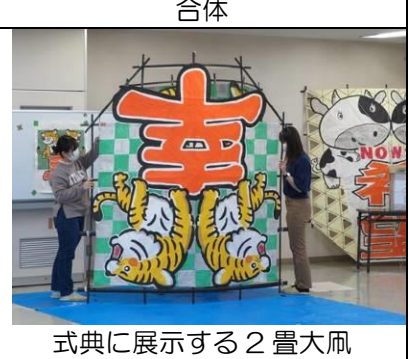
式典に展示する2畳大風