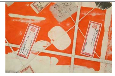
大凧の裏に貼られた「願い札」