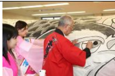
新100畳敷大凧「目入れ式」