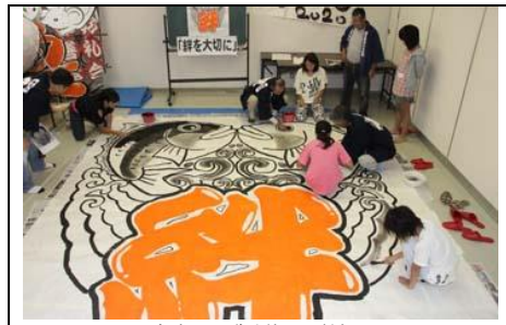
昨年の製作の様子