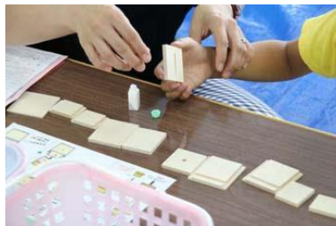
からくり工作 貯金箱