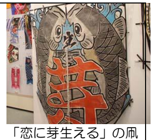
「恋に芽生える」の凧

「外へ出たいな。」という気分になりますね。春はイベントも多い季節です。この機会に色々回ってみてはいかがでしょうか。もちろん大凧会館ご来館も大歓迎です。