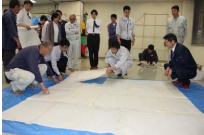
昨年の講習会の様子

早いもので、今年もあっという間に3月の末になり、寒い日が年明けから非常に多かったですが、さすがに日一日と春の訪れは近づいており、桜の便りもあちこちで聞かれる季節となりました。この時期になると東近江大凧会館では、5月の最終日曜日に開催される東近江大凧まつりに向け、ミニ東近江大凧コンテストの凧作り講習会の募集をする時期でもあります。毎年多くのグループの皆さんにミニ大凧作りに来ていただいております。参加される皆さんはそれぞれ個性のある絵柄や判じもんを考へて、この世に一つのすばらしいミニ大凧が作られております。会場も東近江市ふれあい運動公園で三年目を迎え、ミニ東近江大凧のコンテストの専用会場も設けられ、作られたミニ大凧が何度となく揚げておられます。自分たちで考えた自分たちだけの凧を作り、大凧を通して多くの方々が楽しみながら製作できるよう、今年も東近江大凧保存会の方や大凧会館の職員がお手伝いをする講習会に参加される方々を募集することになりました。講習会の凧のサイズは、2畳敷サイズで、4月、5月の2回に分けて行いますが、どちらも先着順となりますので、申し込みは早めにお願ひします。