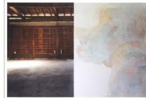
背面の景色 yumiko FUJINO solo exhibition