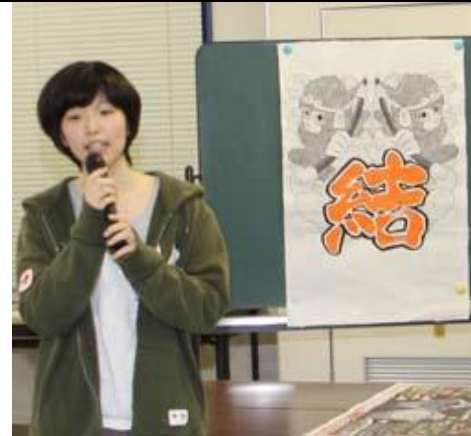
図柄デザイン・考案者した本持さん

新成人のみなさんには、大人の仲間入りをして社会に出ていくと、今までにない新しい人間関係に出会うことになります。自分自身の身に結ばれていく新しい縁を大切にして、社会で結ばれた縁で活躍してほしいという願いを表しています。