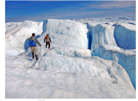
グリーンランド 中西部の氷河調査

7/10(水)～10/6(日) 地球温暖化現象が最も進んでいると言われる北極の環境変化の現状や課題、調査方法とあわせて、東近江市での暮らしにどのような影響を与えているのかも紹介します。