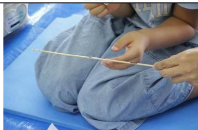
竹にボンドを塗ります。