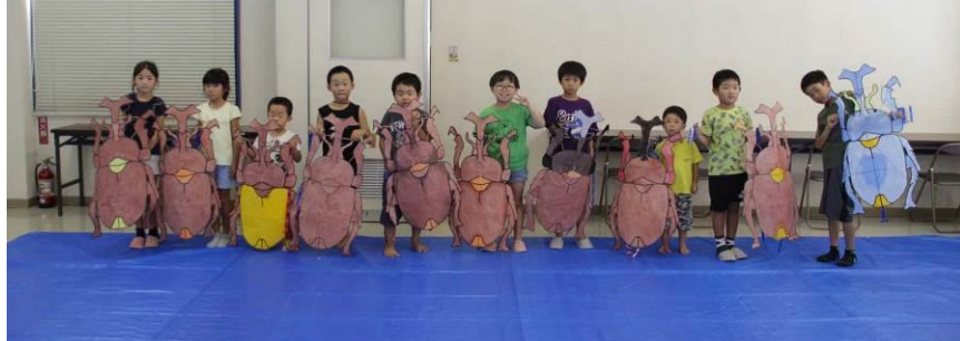
8月19日(土)午後の様子