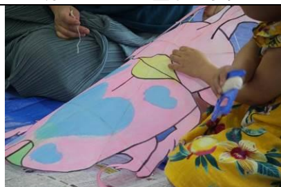
糸を取り付け完成