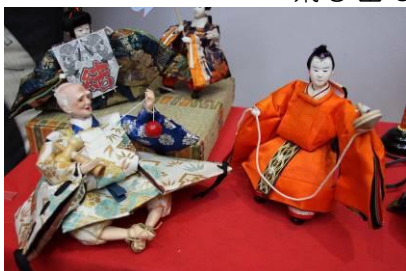
コマとけん玉 技を伝授