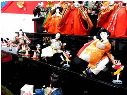
飛び出しひな人形