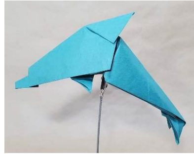
高学年向け「イルカ」

開催日時: 7/26(日) 第1回 10:30~12:00 第2回 13:30~15:00 参加費: 800円 定員: 各回20名 対象: 小学生(保護者同伴)